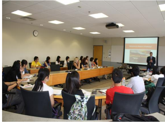
波士顿大学 法学院课堂