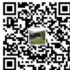
PKU Law Global Program (国际交流)