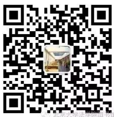
法学院法律图书馆