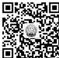
法律人微信平台 (学生事务)