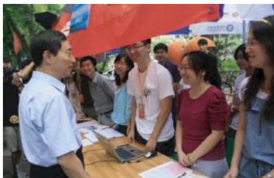
副书记视察法学院接待站

2010年9月1日,北京大学迎来了满怀希望与梦想的2010级新生。为保证新生报到、注册的顺利进行,法学院学生工作办公室、团委、教务、行政等部门通力协作,法学院学生会、研究生会、法律硕士联合会等学生组织倾力投入,全面开展新生报到的接待服务工作。