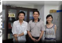
海南实践团成员采访海南省福利处处长