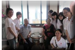
邹平实践团走访新农村敬老院