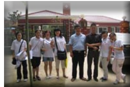
河南实践团在村卫生所前合影