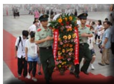
长沙实践团向韶山毛主席铜像敬献花篮