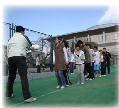
图为法学院代表队团体跳绳项目比赛场景

但是, 她说, 在法学院组织方阵人员时, 她抓住机会, 积极参与进去, 并且和另一名同学一起担任了法学院方阵护旗手的任务。另外, 她在法学院进行比赛时, 和团小组的同学们一起到五四体育场为法学院的运动健儿们加油助威。充分感受到了赛场上的激情和运动员们的拼搏精神。当在运动场的广播中听到法学院取得的优异成绩时, 她们不禁为作为法学院的一员而感到自豪。这也算以另一种姿态参与到校运动会之中了吧!