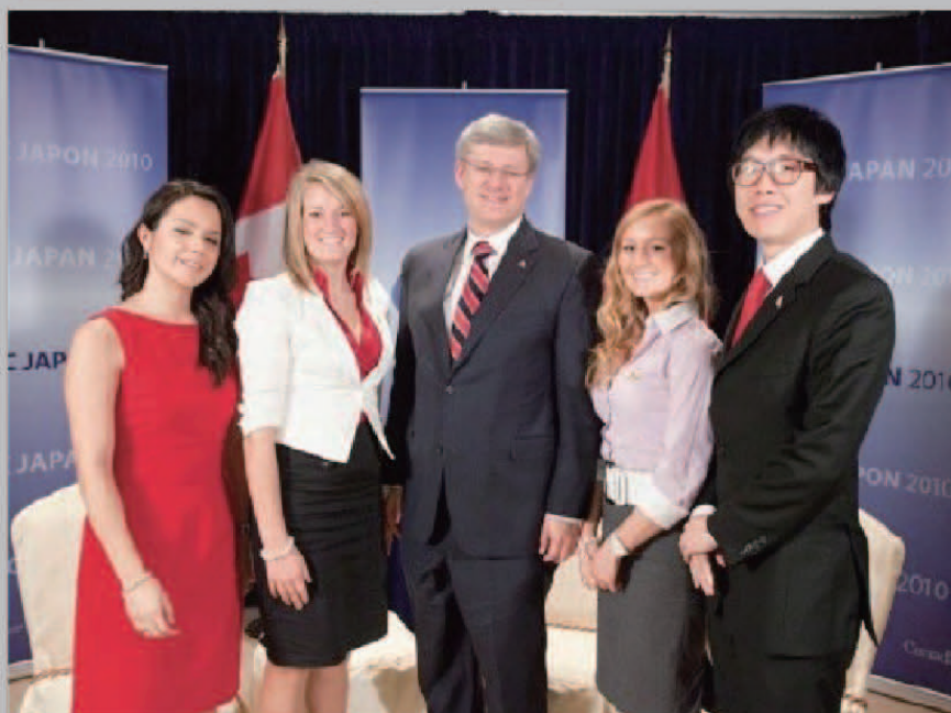
▲ 2010年11月在亚太经济合作组织日本峰会上，加拿大总理斯蒂文·哈珀先生与全球视野组织的青年代表合影