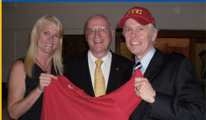
▲ 2010年8月加拿大青少年贸易代表团访华，全球视野组织主管艾米·格劳克斯女士、全球视野组织主席泰瑞·克里福特先生、与加拿大驻华大使戴维·马尔罗尼先生于北京合影