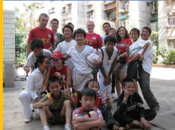
▶ 2010年8月加拿大青少年贸易代表团的青少年大使和在加拿大国际发展机构为非北京户口的中国儿童创办的学校里接受义务教育的中国学生在北京的合影