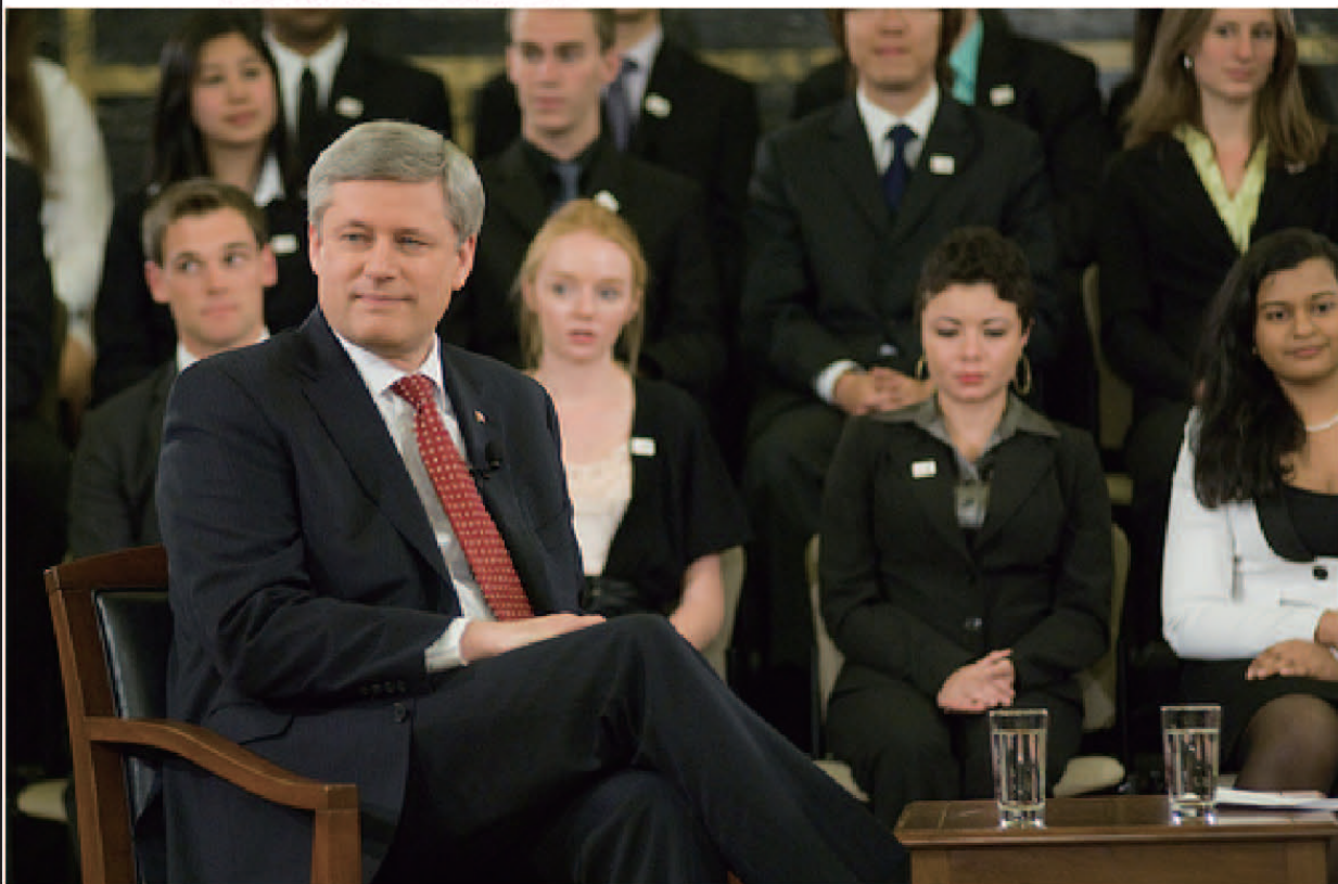
▲ 2010年5月在加拿大首都渥太华的加拿大全国青年高层会议上，加拿大总理斯蒂文·哈珀先生与全球视野组织的青年代表会谈时的照片

加拿大全国青年高层会议由全球视野组织、加拿大外事部门与国际贸易和联邦经济发展机关联合主办。在加拿大全国青年高层会议上，遴选出的代表各个地区的加拿大青年聚首于首都渥太华。加拿大全国青年高层会议给年轻人提供了发表见解和主张的机会，并保证政界商界的领袖能听到这些年轻人的声音。