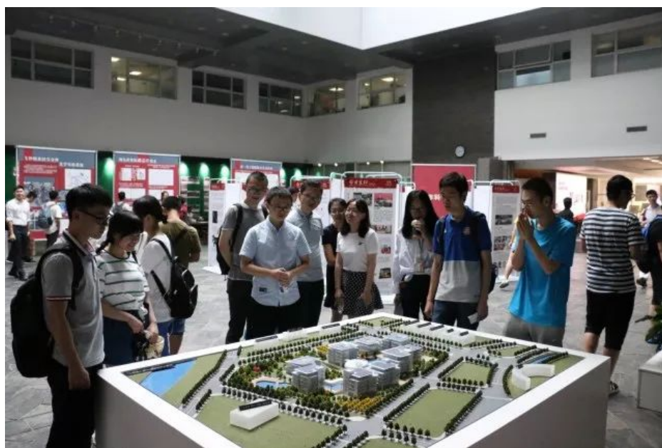
图 19 同学们在生命科学大楼仔细参观

随后，师生前往金光生命科学大楼参观北大理工医科 5 年科研成就展。同学们认真阅读科研成就展板，了解近 5 年来北京大学所取得的各项科研成果；同时，还参观了生命科学学院系列展板，了解生命科学教学培养、实验室建设、科研成果和校友组织等情况，感受到了北京大学学科建设的最新成就。