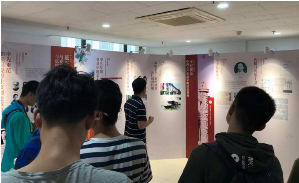
图 16 老师讲解「牢记使命」「砥砺前行」板块内容