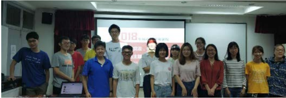
图 1 支部集体合影