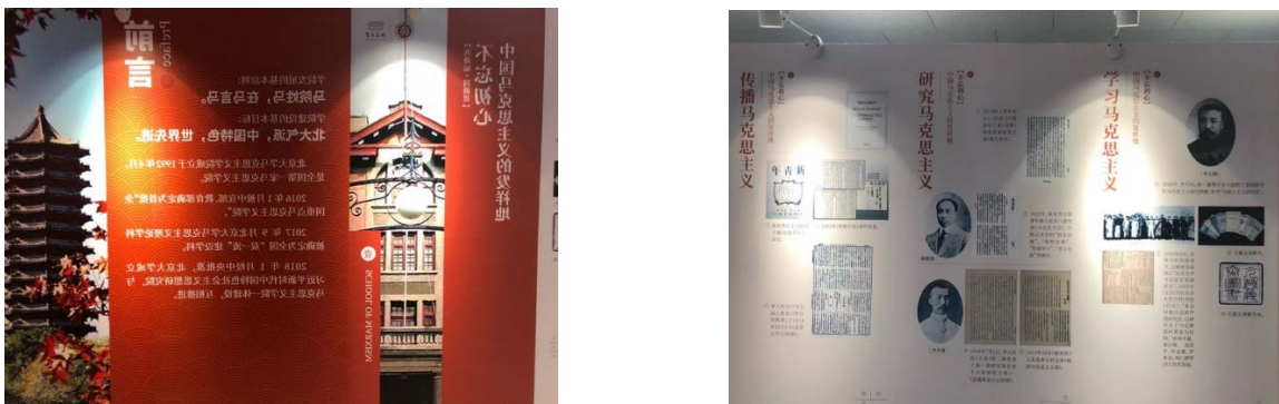
图 15 「不忘初心」主题板块展览内容

活动共分为三项主要内容。首先，参与活动的师生前往马克思主义学院，在马克思主义学院团委书记毕照卿的带领下，师生一同参观“共命运·同前进”专题展览。展览主要介绍了马克思主义在中国传播、发展的历史，北京大学作为马克思主义传播的主要阵地的历史地位和马克思主义学院近年来的发展状况。同学们依次参观“不忘初心”“牢记使命”“砥砺前行”“引领未来”四个板块，了解到北大与马克思主义的历史渊源、马克思主义学院办学的最新方向与理论实践成果。