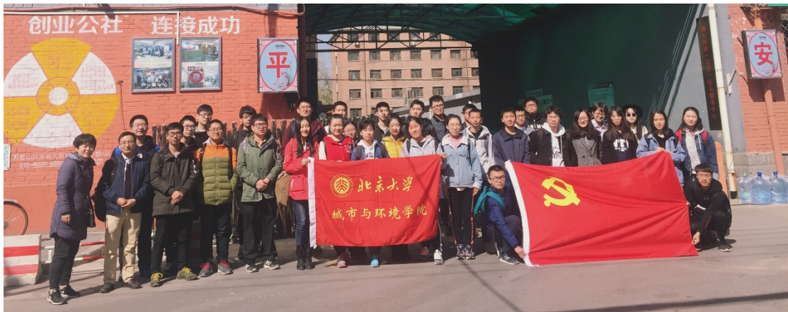
图 21 北京大学城市与环境学院参访团于首钢旧址合影

2018年4月8日，城市与环境学院2015-2017本科党支部与人文地理学研究方法课程师生一行39人在童昕老师的带领下先后前往北京市首钢集团旧址创业公社与北京市园博园进行参访调研，首钢集团创业公社和园博园分别是工业遗址改造和永定河流域治理的典型案列。