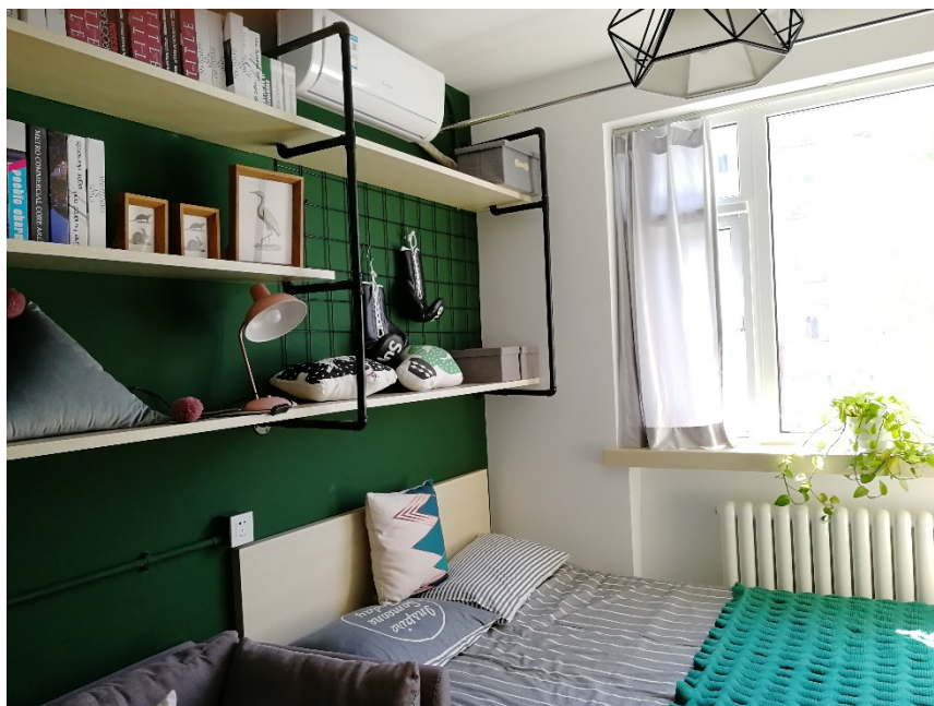
图 23 首钢单身公寓内部