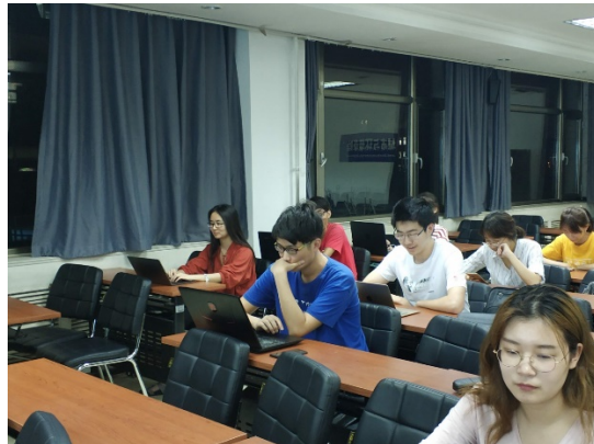
图 12 同学们认真听讲并参与其中

在介绍的同时提问党史相关内容，让同学们认真回答参与其中，同学们认真的回答也学到了很多关于党史的知识。