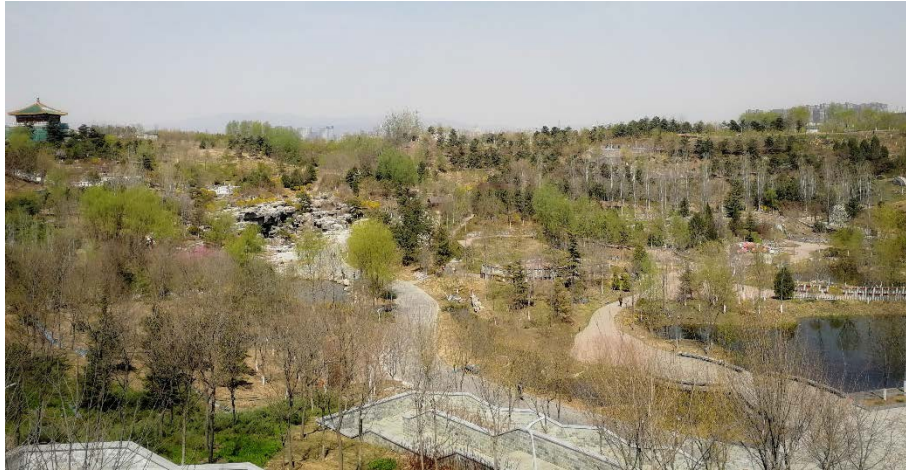
图 24 园博园锦绣谷现貌

师生沿着湿地公园进行游览考察，据此案例，老师结合专业知识为大家进行了海绵城市的解析。