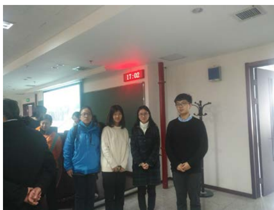
图10 支部人员参会人员合影