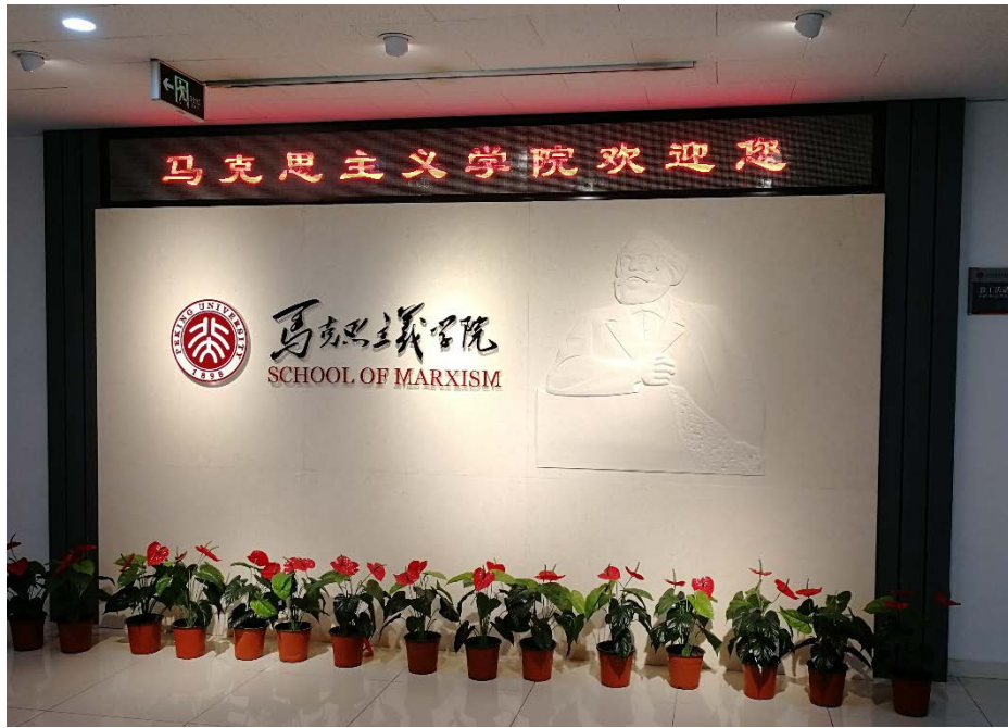
图 14 马克思主义学院专题展览

活动共分为三项主要内容。首先，参与活动的师生前往马克思主义学院，在马克思主义学院团委书记毕照卿的带领下，师生一同参观“共命运·同前进”专题展览。展览主要介绍了马克思主义在中国传播、发展的历史，北京大学作为马克思主义传播的主要阵地的历史地位和马克思主义学院近年来的发展状况。同学们依次参观“不忘初心”“牢记使命”“砥砺前行”“引领未来”四个板块，了解到北大与马克思主义的历史渊源、马克思主义学院办学的最新方向与理论实践成果。