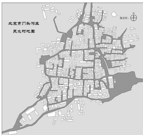
图 26 灵水村平面图（支部同学自绘）

在调研前夕，支部成员通过查阅文献等方式，对灵水举人村有了初步了解，确定了研究思路与发现，并为调研做了充足准备。随后支部成员于 2018 年 4 月 28、29 日以及 5 月 6 日先后两次前往灵水举人村实地考察。通过向游客与村民发放问卷进行调查，对游客、村民、施工工人以及开发商等进行结构性访谈，以及实地考察，支部成员对灵水举人村有了深入了解。