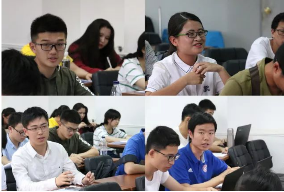
图 20 学生们积极发言

此次集体学习是城市与环境学院党委为深入学习习近平总书记在北京大学师生座谈会上的重要讲话精神、提升师生认识水平和理论素养、强化思想政治教育举办的系列活动之一，2015-2017 级本科党支部成员积极参与其中，认真学习讲话精神。参会师生在活动中受到了很大的触动，深化了对总书记讲话精神的认识，增强了责任意识与大局意识，并表示将继承北大光荣传统，不忘初心、不辱使命、夯实根基、久久为功，为中华民族伟大复兴的中国梦而不懈奋斗。