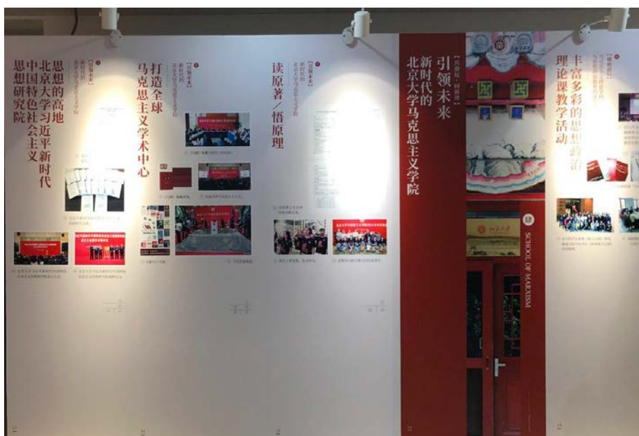
图 18 「引领未来」主题板块展览内容

随后，师生前往金光生命科学大楼参观北大理工医科 5 年科研成就展。同学们认真阅读科研成就展板，了解近 5 年来北京大学所取得的各项科研成果；同时，还参观了生命科学学院系列展板，了解生命科学教学培养、实验室建设、科研成果和校友组织等情况，感受到了北京大学学科建设的最新成就。