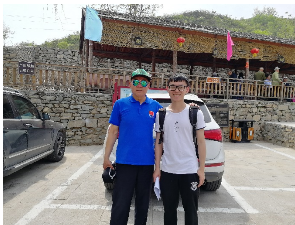
图 27 支部书记与访谈游客合影

在调研过程中，支部同学欣喜于京郊环境之好，却也为当地经济发展滞后感伤，对灵水举人村旅游开发过程中传统建筑的破坏以及新建仿古建筑的同质化感慨，同时也为游客给村民生活带来的消极影响感叹。调研同学表示，传统村落旅游开发应当建立在保护的基础上，应当是保护性开发，而不是破坏性开发；应当紧紧围绕其特色进行开发，而不是同质化恶性竞争；应该是多元主体参与开发，而不是单一主体主导无视其他主体权益式的开发。